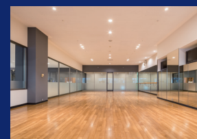
レッスン用スタジオ