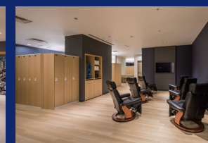
シャワー・ロッカールーム完備